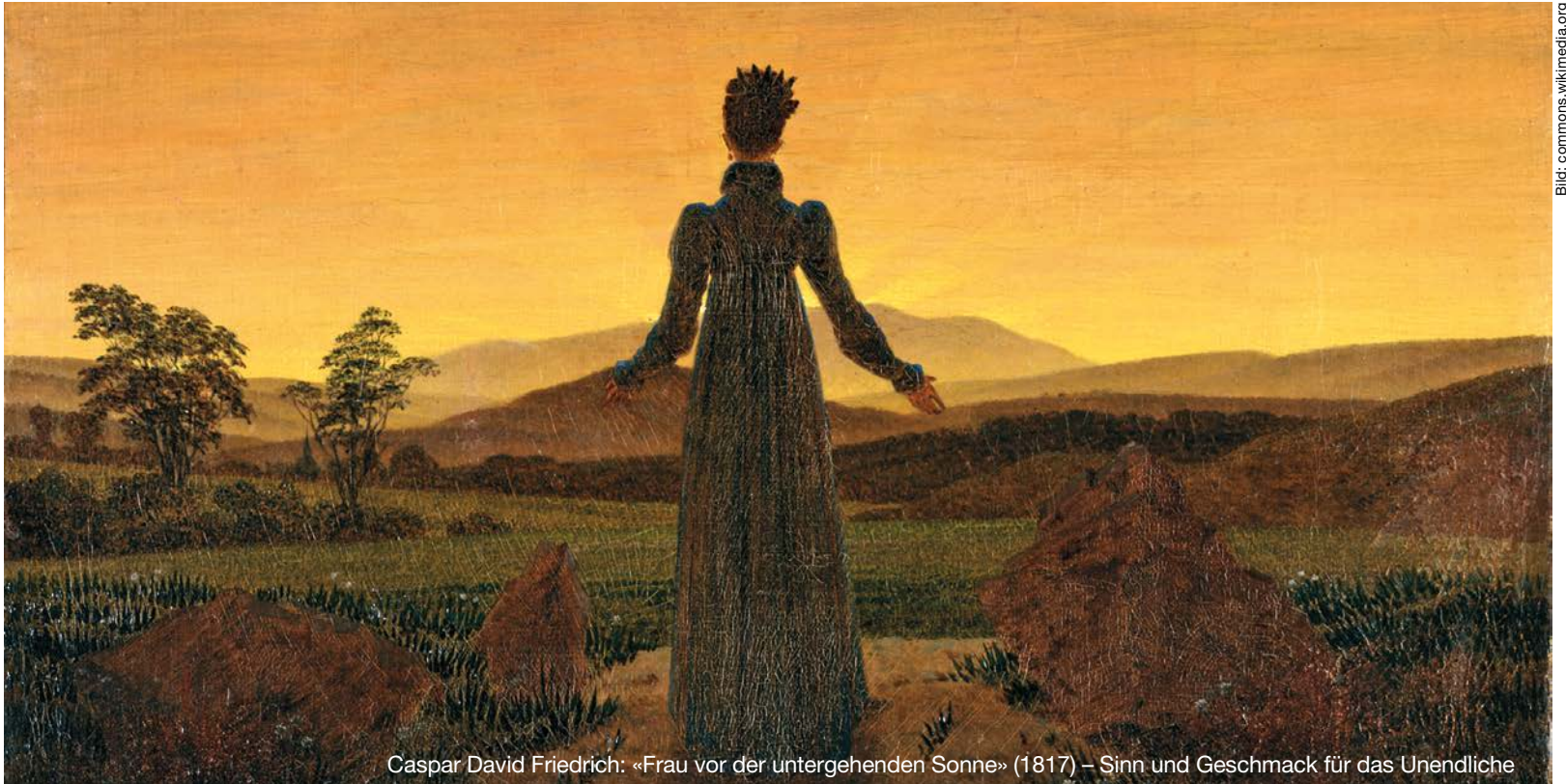
Caspar David Friedrich: «Frau vor der untergehenden Sonne» (1817) – Sinn und Geschmack für das Unendliche