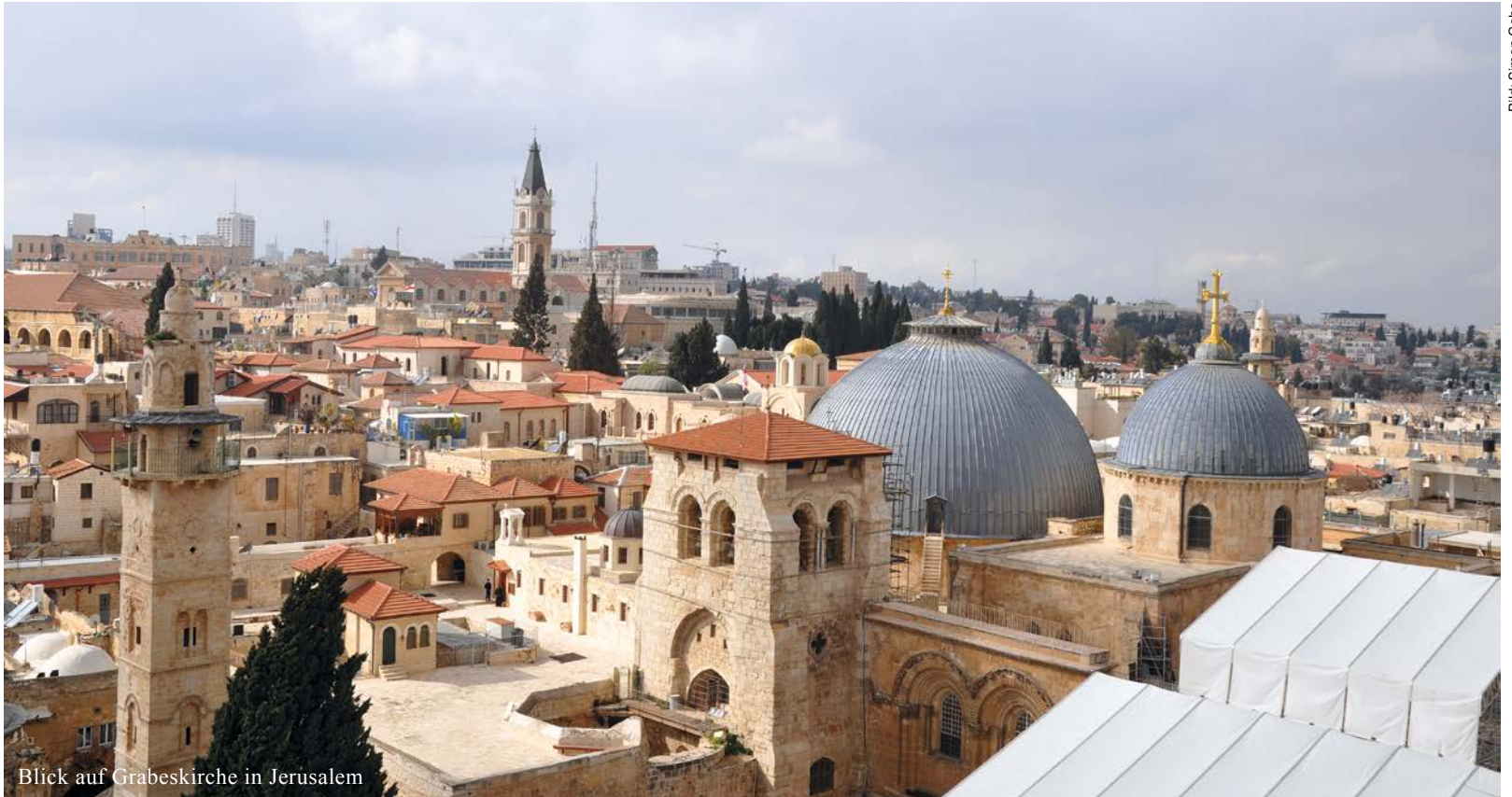
Blick auf Grabeskirche in Jerusalem