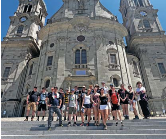
Konfreise nach Einsiedeln