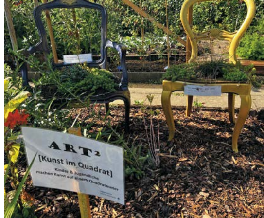
Kunst im Gemeinschaftsgarten