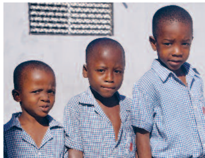
Schulknaben in Haiti